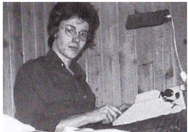
Stieg Larsson i mitten av 70-talet