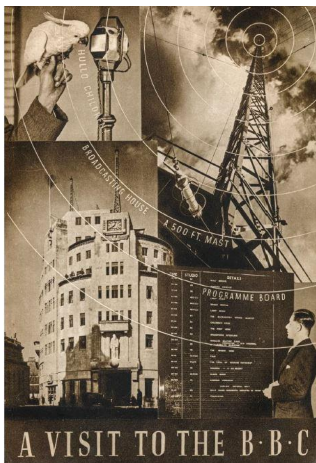
Reklam för BBC 1937