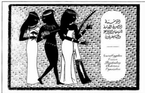
h-reds QSL från 1965

Radio Cairo in Egypt broadcasts to Europe on 12050 kHz with German at 19.00 UTC and French at 20.00 UTC. The signal is very strong but the audio quality is extremely poor which makes reception almost impossible.