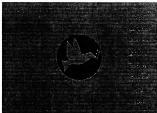
RFA's holiday QSL card promoting world peace.

Radio Free Asia (RFA) announces its new QSL card which promotes world peace. The design is from one of the many holiday cards RFA has used in the past. Besides the dove as the card's center piece, there are eight different renditions of the word 'peace' on the right margin. The eight versions represent each of our broadcast languages: Burmese, Chinese (Mandarin and Cantonese), Khmer, Korean, Lao, Tibetan, Uyghur and Vietnamese. The card will be used to confirm all valid reception reports for December 1, 2008 – January 31, 2009.