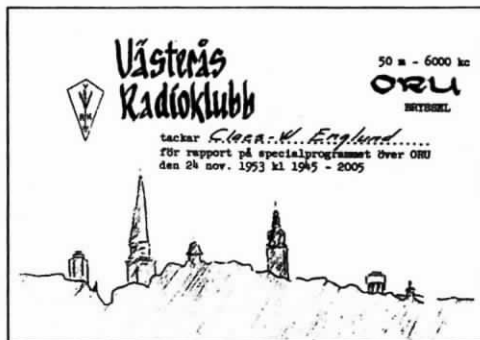
QSL från VRK/ORU 1953

Själv började jag lyssna på hösten 1952 och bland de första stationerna var The International Goodwill Station of ORU i Bryssel (Wavre 6000 khz), som den 1 augusti 1952 övertog sändningarna från OTC i Leopoldville i Belgiska Kongo. De sände väldigt populära DX-program och program på svenska. Jag har väl 30-talet QSL kort från ORU och olika DX-klubbar som sände specialprogram på den tiden. Bland mina QSL hittar jag också Radio Congo Belge i Leopoldville-Kalina från Belgiska Kongo och Radio Brazzaville från Franska Equatorialafrika, som ju också sände på svenska från mynningen av Kongofloden. Vid denna tid var jag i 14-15 årsåldern och lite spännande och intressant är det att i dag ta reda på vad det var som födde detta stora intresse för Kongo.