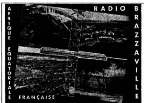
QSL från R Brazzaville 1951

Kolonialmakten Belgien rekryterade en stor del av sin arbetskraft bland nordbor. När Kongo blev självständigt 1960 från Belgien utbröt inbördeskrig och Sverige skickade, på FN:s generalsekreterare Dag Hammarskölds begäran tusentals soldater. Många föremål i de etnografiska museernas samlingar i världen har förvärvat under kolonialtiden (ca 40000 st föremål finns i de nordiska etnografiska museernas samlingar, f.ö. är det dessa museer som står bakom utställningen och den skall vandra runt i Norden efter Stockholm) och en hel del av dessa intressanta och vackra föremål visas på utställningen. Vid ett föredrag på Utrikespolitiska Institutet i Stockholm (se f.ö. deras länderöversikter på hemsidan www.ui.se ) lyssnade jag till FN:s höge tjänsteman i Kongo berätta om förberedelserna för val i Kongo, ett land som till ytan är stort som halva Europa men inte på långa vägar samma infrastruktur med vägar etc som vi.