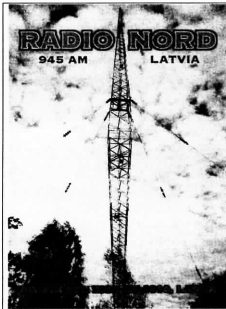
QSL från Radio Nord/KREBS TV