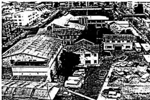
Radio HCJB:s anläggning i Quito, Ecuador.