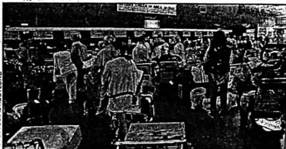
INFORMATION PER RADIO: En reklamfinansierad lokalradiokanal dygnet runt kan bli verklighet i höst tror SAS, luftfartsverket och Arlandagruppen.