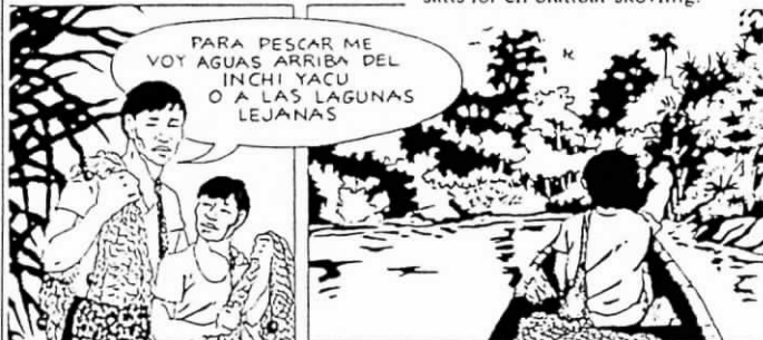
De tecknade bilderna kommer från ett av indianerna producerat didaktiskt material från CONFENIAE.

av hela invånarantalet i Ecuador (folkmängd 10 506 668, juni -90). Inte nog med detta: 1984 bildades COICA (Samordningsorganet för Amazonasbäckens indianer) på initiativ av en peruansk shuar (som där kallas aguaruna, Evaristo Nugkuag, vilken år 1986 fick mottaga The Right Livelihood Award (det alternativa Nobelpriset) för COICAs miljövärdande arbete. I COICA har Ecuadors djungelindianer slutit sig samman med hundratals olika regnskogsfolk i fem olika Amazonasstater: Ecuador, Peru, Colombia, Brasilien och Bolivia. Amazonasindianernas förenade nationer representerar nära 1 miljon människor, vilkas största problem är att över huvud taget få finnas till, då deras jordrättigheter inte befästes och skogen — deras och Amazonasstaternas livsvillkor — utsatts för en ofattbar skövling.