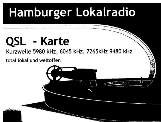
h-reds QSL från 2012

This time we start in Germany with the new schedule of the Hamburger Lokalradio or Hamburg's Local Radio in English. The station broadcasts on FM locally in Hamburg but can also be heard on shortwave on Saturdays and Sundays. On Saturdays the Halmburger Lokalradio can be heard on 6190 kHz from 07:00 until 11:00 UTC and then on 7265 kHz from 11:00 until close down at 16:00 UTC. On Sundays the station uses 9485 kHz from 12:00 until 15:00 UTC. Programming is in German and English.