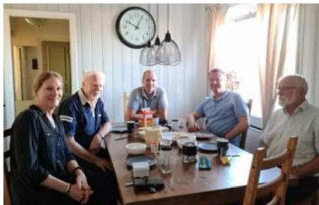
RÅ, JE, BIH, SGD och TN

/ Text och foto: Thomas Nilsson via MVE 62-7 /