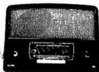
Domestic receiver model 2623 made by Aga in Stockholm Sweden 1955

WQAM Miami FL – 560 e-mail BIH WVMT Burlington VT – 620 e-mail BIH WKGM Smithfield VA – 940 BIH WXCN Claremont NC – 1170 FB svar BIH KTIX Pendelton OR – 1240 e-mail 3d APF